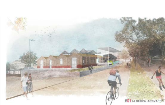
Primer premio Edición 2015-16 ETSAVA