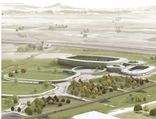
1º Premio Edición 17-18 ETSAVA