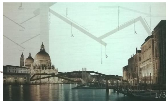
Primer premio Edición 2014-15 ETSAVA