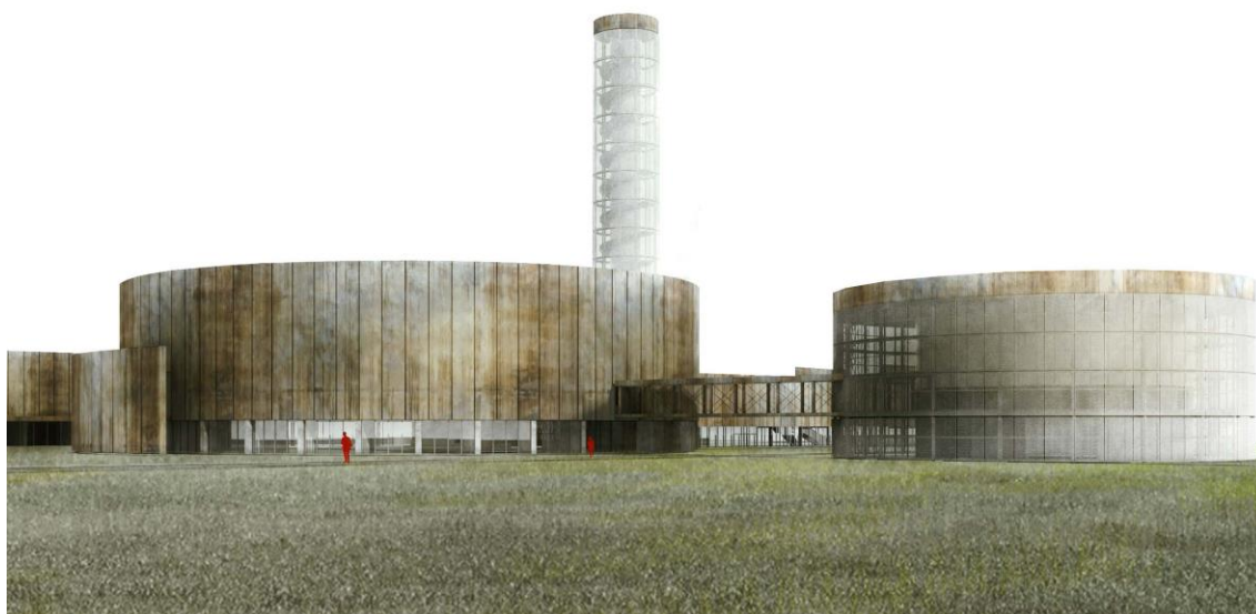
Accésit 7ª Edición Premios Schindler España de Arquitectura. 2º Premio Edición 17-18 ETSAVA