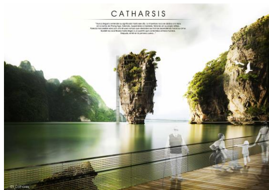
Primer premio Edición 2016-17 ETSAVA